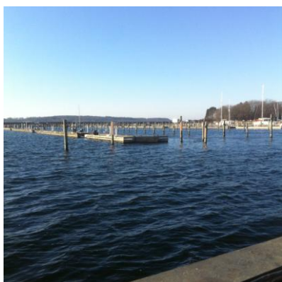
Bro 4 rettet op og på plads