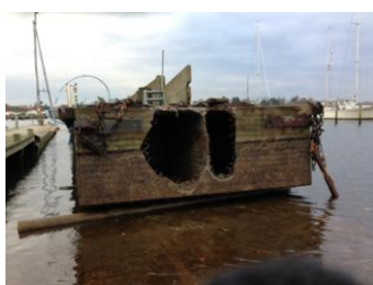
Hullet på pontonen er nu lukket