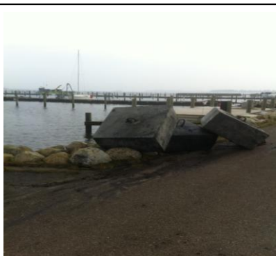
Vi fandt nogle af de gamle ankere, desværre ikke alle - alle i god stand